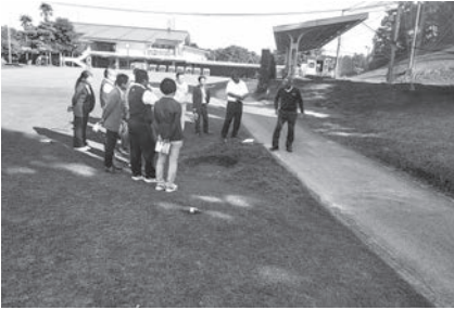
小郡CCで開催されたレベル1入門ルールスクール

九州ゴルフ連盟（GUK）競技委員他委員会委員、加盟倶楽部会員、各県ゴルフ協会推薦者を対象とした「レベル1入門ルールスクール」が10月27日、福岡県小郡市の小郡カンツリー倶楽部で開催された。今回の受講者は23人。規則概要の説明、実地講習、質疑応答、Web上でのテストなどが実施された。