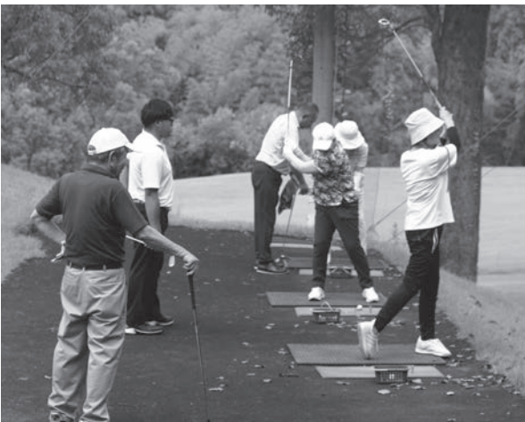
アイアンの練習をする生徒たち

の草花などの雑草や小さな花が変わって行くのを見るのが楽しい。この近所にはアオサギが結構いるのですが、それが子どもを産んで、子どもと一緒に飛んで行ったりする。クリークの中にいるんですけどね。